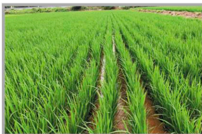
전북 부안 (처리 후 31일)