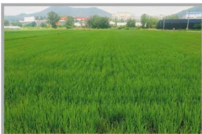
경기 용인 (처리 후 37일)