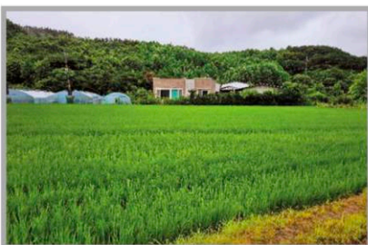
충남 청양 (처리 후 35일)