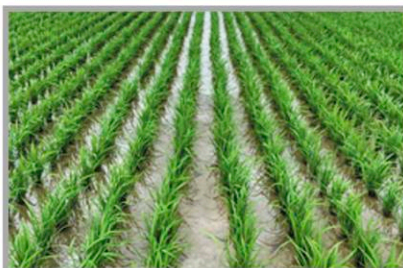
전북 김제시 (처리 후 38일)