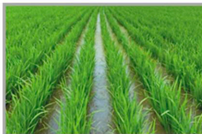
경남 함안군 (처리 후 20일)