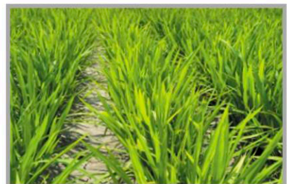
인천 강화군 (처리 후 37일)